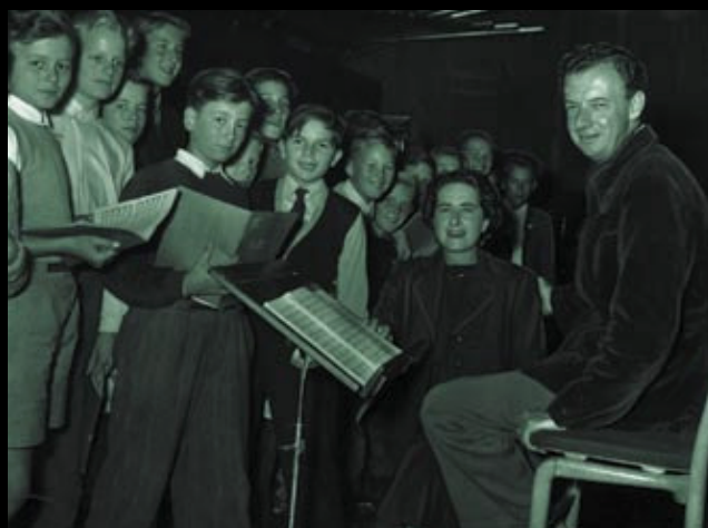
Benjamin Britten (1913-1976) med Københavns Drengeskor i 1953

Advent og jul synges ind i år med dette værk sammen med julesange af to af den anglikanske korverdens mest populære nutidige navne: John Rutter og Morten Lauridsen.