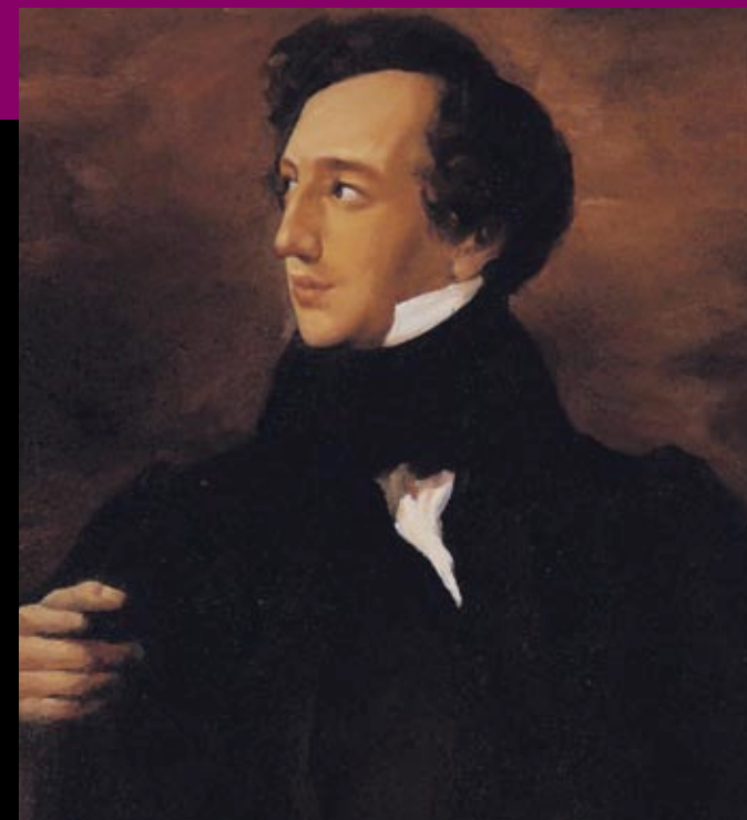
Felix Mendelssohn-Bartholdy (1809-1847)

Koralkantater for kor og strygere Christe, du Lamm Gottes Wer nun den lieben Gott lässt walten Motet: Denn er hat seinen Engel befohlen Hör mein Bitten