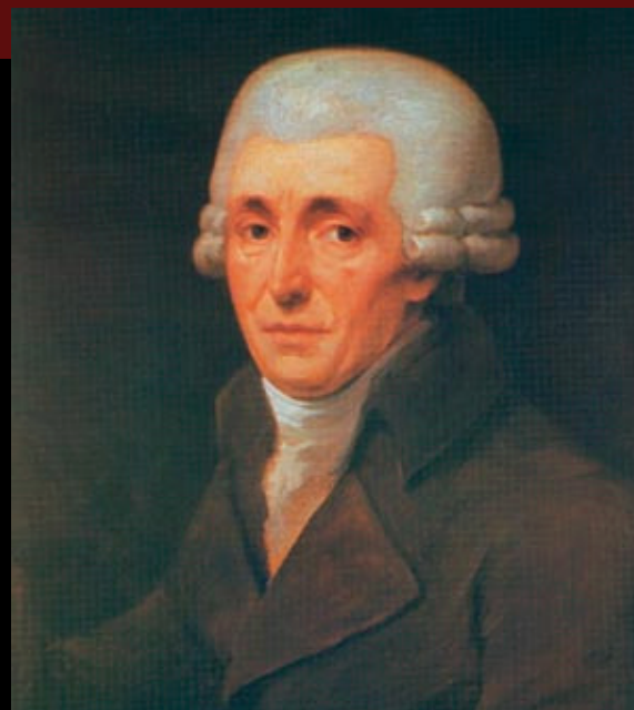
Joseph Haydn (1732-1809)

Det er med en opførelse af Nelson Messen, at Københavns Drengekor markerer 50 året for overflytningen fra Christiansborg Slotskirke til Vor Frue Kirke. Ikke kun højmesserne og en række andre kirkelige handlinger, men også de navnkundige Fredagskoncerter fulgte med til Københavns Domkirke.