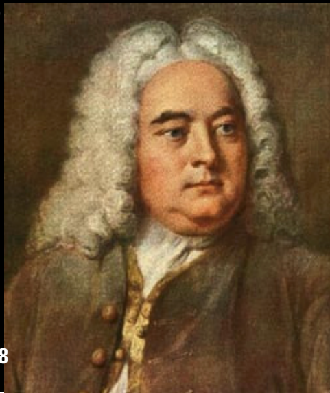
George Frideric Handel (1685-1759)

Københavns Drengkor tager hul på fejringen af Händel og Purcell med nogle af disse Anthems, hvor den musikalske pragtudfoldelse ikke står tilbage for det flotte skue en kroning var og stadig er i England. Men musikken er ikke kun ydre pragt: de mange tekster fra Det Gamle Testamente giver rigelig plads for åndelig fordybelse...