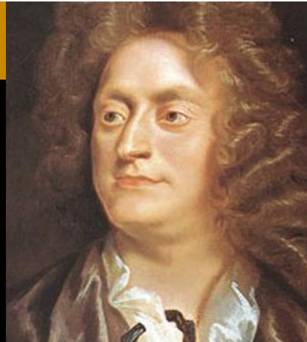
Henry Purcell (1659-1695)